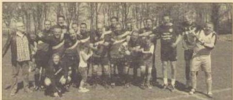
Het kampioensteam van Geusselt Sport 3

Het 3e team won alle wedstrijden na de winterstop en werd zo kampioen nummer drie.