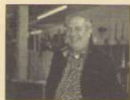
Jacqueline Montulet

Het WVV is volgens Wil een hele leuke buurt met een diversiteit aan culturen, verscheidenheid van mensen en studenten die allemaal in harmonie samen leven. Wil hoopt dat de Frankenstraat nog meer gaat leven. Hij vestigde zich in de Frankenstraat om zo op eigen wijze een bijdrage te leveren aan de leefbaarheid van de Frankenstraat in het bijzonder en het WVV in het algemeen.