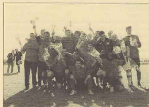
Het kampioenteam van Willem 1

Het afscheidsfeest van de oude locatie van 1 juni j.l. was tegelijk emotioneel en bijzonder. Nu is de zomerstop van kracht, maar stilzitten zit er deze zomer niet in. De verhuizing naar de Discusworp 10 in het Geusseltpark is een feit. In augustus volgt er een openingsfeest samen met de nieuwe huisgenoten van RKASV (Amby). De club dankt alle vrijwilligers die op welke manier dan ook hebben bijgedragen aan een mooie afsluiting van een bijzonder tijdperk. Het echte "kevergevoel" is weer terug en zal gekoesterd worden.