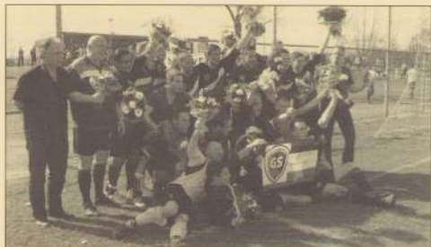
Het kampioensteam van Geusselt Sport 1

Geusselt Sport staat op de voetbalkaart. De club sluit het eerste voetbalseizoen af met vier kampioenen. Nadat half april Geusselt Sport 1 en 2 al de eerste plaats behaalden, was op 5 mei de apotheose voor nog twee teams in de kampioensrace.