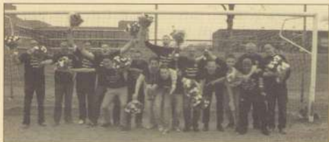
Het kampioensteam van Geusselt Sport 2

Het 3e team won alle wedstrijden na de winterstop en werd zo kampioen nummer drie.