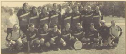
Het kampioensteam van Geusselt Sport 6

Het zesde team was vanaf het begin koploper, maar hield de spanning er tot het laatst in om uiteindelijk toch de titel te pakken.