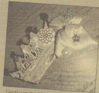
Gerda van den Hout - Met jouw prachtige bloemenpracht maak je de wereld zacht.