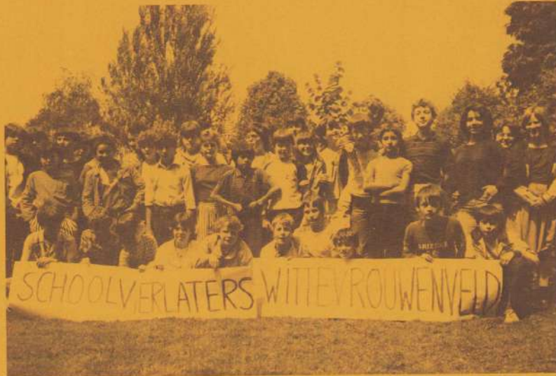
De zesde klassetjes van de Theresia-school blijken de geschiedenis goed te kennen ..... (juli 1984)