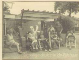
Gezellige drukte in de Pijlstraat

beter luisteren naar de klachten, ze voelen zich 'vergeten'. De buurt kan zoveel mooier! Haar ouders en burens steunen haar van harte, het Buurtplatform eveneens. U hoort er meer van. Er is volop eweging in de buurt om te onderzoeken hoe de buurt veiliger en leefbaarder wordt, uw ideeën zijn welkom! Buurtplatform-WVV(06-40448924)