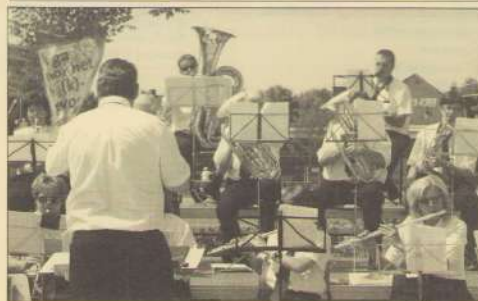
Harmonie in de hitte. Kom meedoen: op ma. 6 sept. drumband, di 7 sept Harmonie.