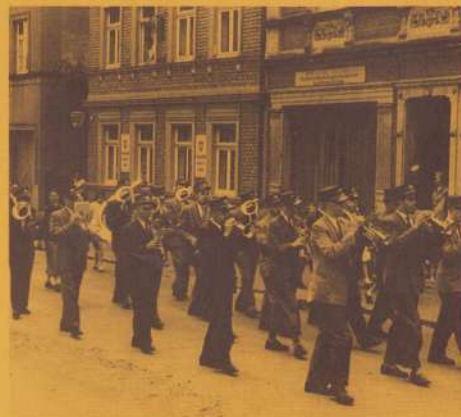
In Giesdorf (D) 1955 met politiepet