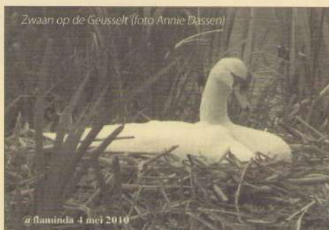
Zwaan op de Geusselt

Helpt allen de buurt schoon en veilig te houden, bewaar deze telefoonnummers en meldt altijd.