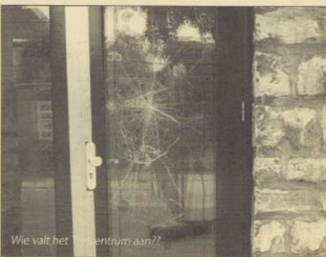
Wie valt het Trefcentrum aan??

Burgerraadsman: woensdagmiddag na afspraak (tel. 362 0066) Nederlands Migratie Instituut: donderdagmiddag van half 2 - half 5 AOW/WIA: iedere dinsdag van 2 - 4 uur over arbeidsongeschiktheid en uitkering in La Belletsa (Heugemerveld, Kardinaal van Rossumplein) Vrouwenrechtswinkel: Spoorweglaan 12: inloopspreekuur op donderdagavond van 7-9 uur en vrijdagmorgen van 10-12 uur Juridisch loket: Avenue Ceramique 2-6, 0900-8020 (gratis advies en info) Klanten (klachten) meldpunt Gemeente: 043 350 4000 of per mail: post@maastricht.nl Opbouwwerk Trajekt: Jan Segerink 06 5569 5243 Wijkagenten: Huub Smeets: 0900 8844 Drugsmeldpunt: 043 350 5111 (alles concreet doorgeven)