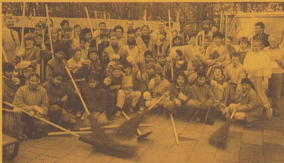
Schoonmaakactie in de buurt