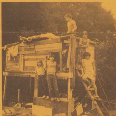
De voormalige bouwspiegelplaats