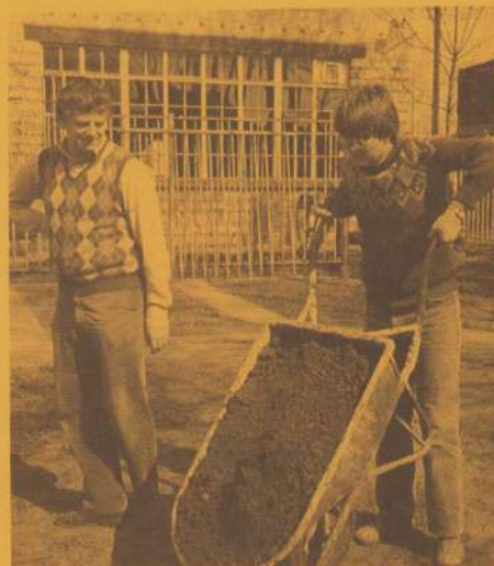
Sjouwen, zwoegen en zweten

Luguber was de ontdekking dat zg. "stoere jongens" een aantal dieren op gruwelijke wijze doodden of zwaar verwonden. Veel kinderen spraken hierover hun verontwaardiging uit in een artikel in de buurtkrant. Onlangs nog werd de pas aangelegde dure verlichting gestolen.