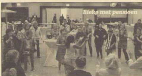
Bieke met pensioen