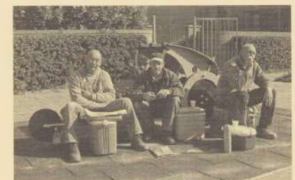
Nieuw speeltje in de Pijlstraat