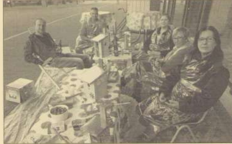
Vogelhuisjes schilderen op Burendag