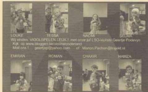
Elke vrijdagmiddag boven in het Trefcentrum: vioolles voor kinderen van 6-10 jaar, kost 1 euro (tussen kwart voor 4 en 5 uur)

2 november: Allerzielenmis van 19.00 tot 20.00 uur in OLVr-kerk 20.00 - 20.30: lichtstoet van kerk naar begraafplaats 20.00-22.00: koffie, thee, glühwein in 't uitvaartcentrum op begraafplaats-Oostermaas Route vd stoet: Voltaplein, Stadhoudersstraat, Hofmeiersplein, Parmastraat, Aartshertogenstraat ... Met speciale medewerking van Happy kids en Gele Rijders.