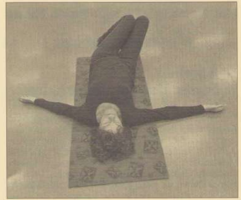
Elke maandagmiddag tussen 1 en 2 uur: gymnastiek voor vrouwen