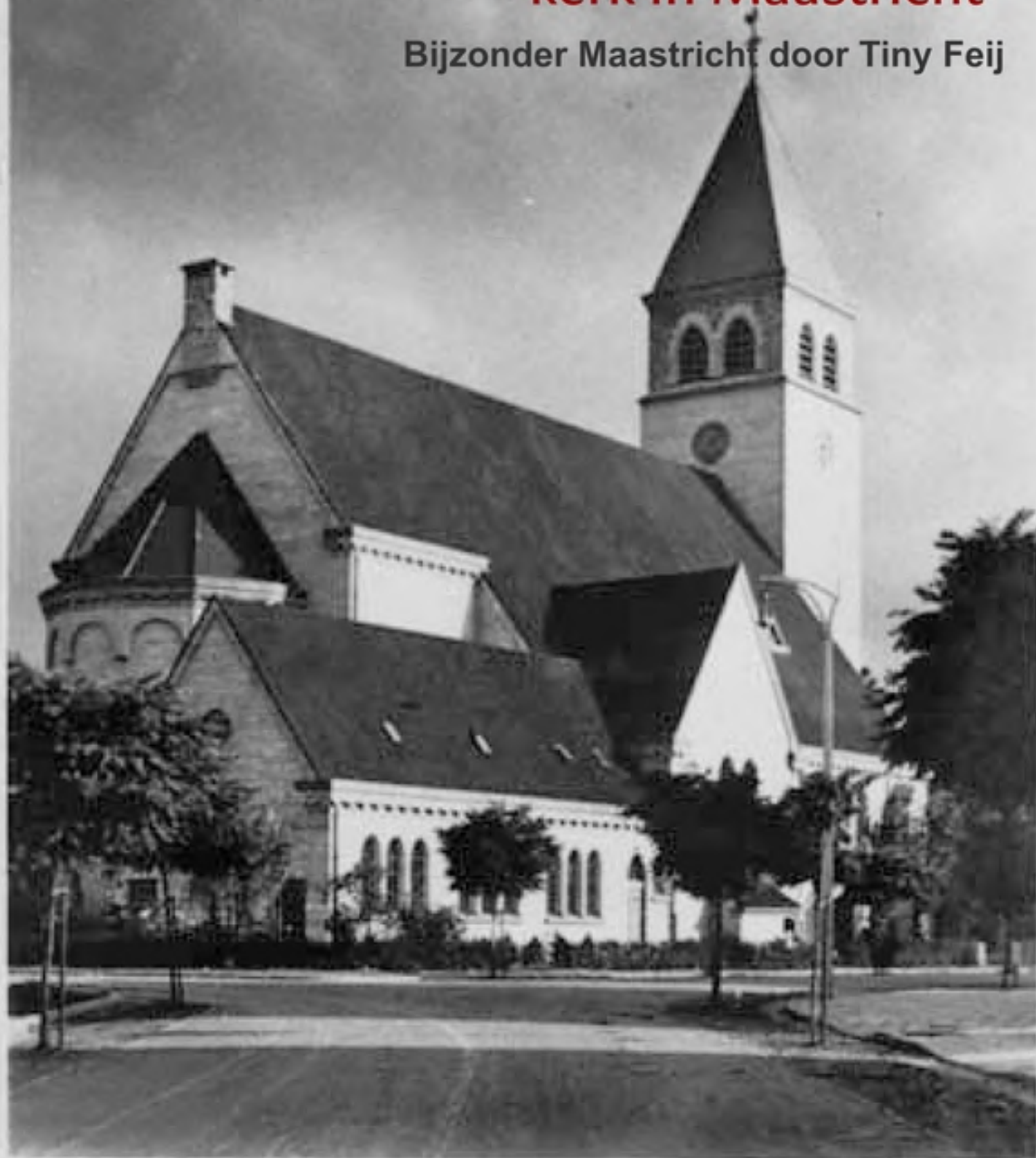
St. Antoniuskerk, Scharn - Maastricht