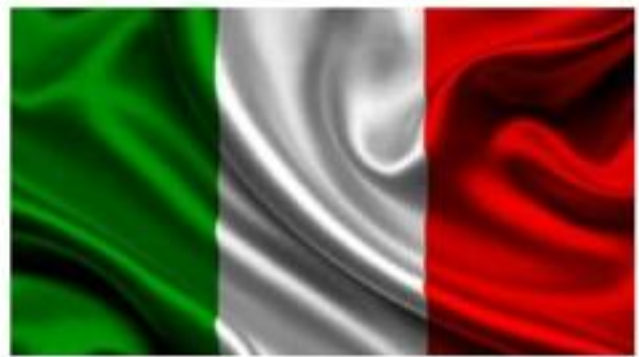
De Italiaanse vlag wapperde op de kerk van Scharn