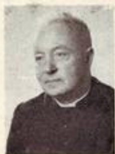
JOS. JANSSEN +

Empereur de l'Abyssinie Descendant de Salomon-Saba.