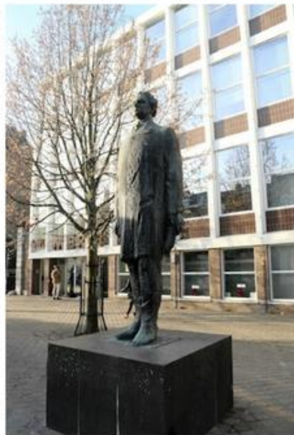
Beeld van Regout aan de Boschstraat