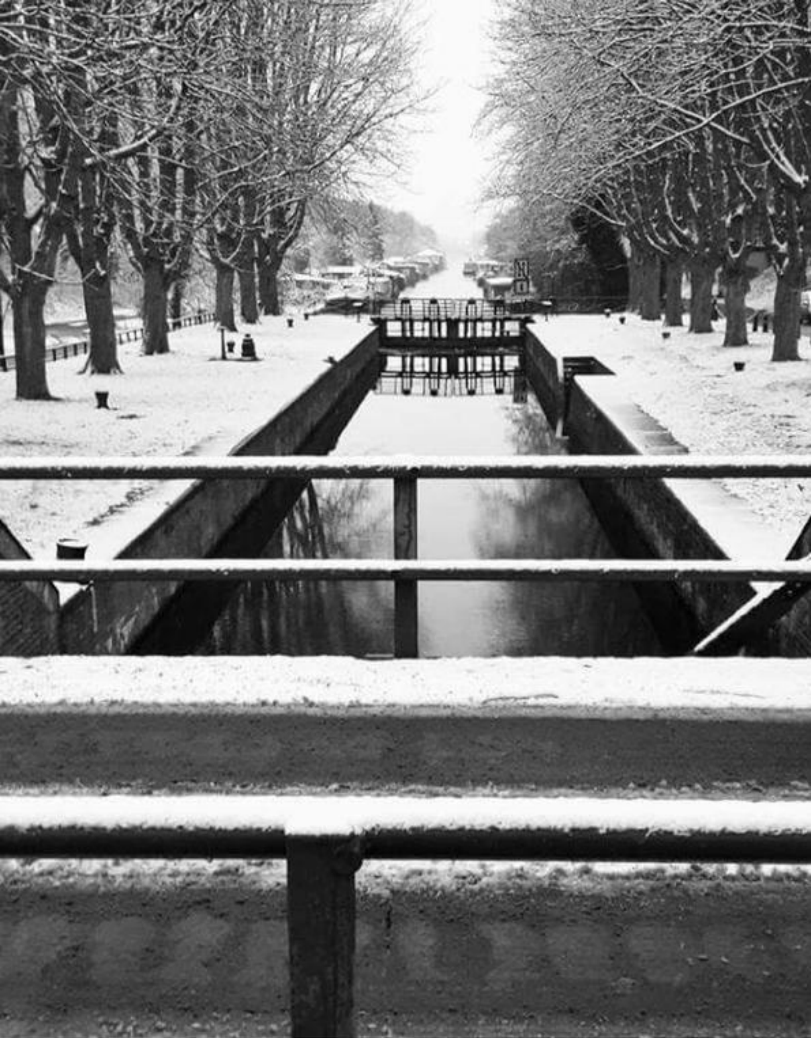
Winters Maastricht