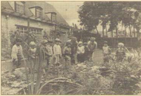
Kent u iemand van deze foto?