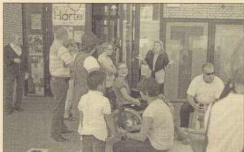
Resto deed mee aan de Burendag.