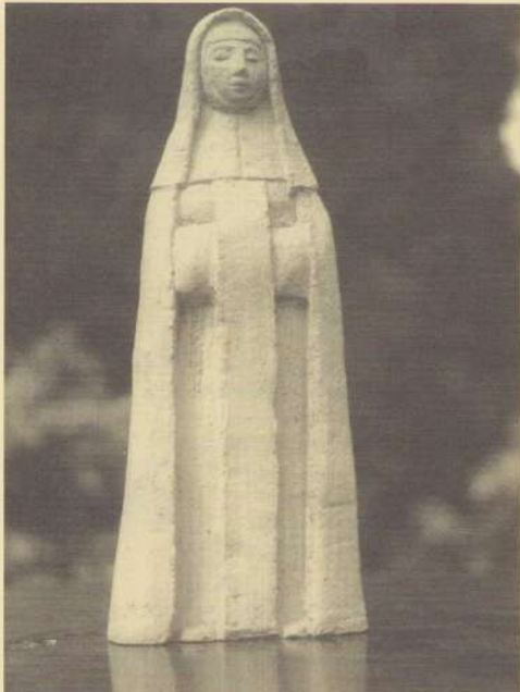
Maria-beeldje ooit gemaakt door Pie Hameleers.

E.v. herinnerings-bewonersoverleg dinsdag 18 okt. (2 uur-Kunstketel) of donderd. 27 okt. 7 uur.