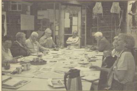
Herinneringen aan vroeger.

De buurt gaat op de schop door de aanleg van de A2, u hebt het al gemerkt. Alles gaat veranderen, over een paar jaar zal het er heel anders gaan uitzien. Daarom starten wij een nieuw project: we willen alle mooie, unieke plekken in de buurt bewaren. Met uw hulp starten wij het project Buurtherinneringen . Heeft u mooie foto's van vroeger die de moeite waard zijn? En kunt u er een leuk verhaal bij vertellen? Het maakt niet uit, straten, huizen, bekende buurtbewoners, alle verzamelingen en vooral verhalen zijn welkom! Wij bewaren ze graag voor u en