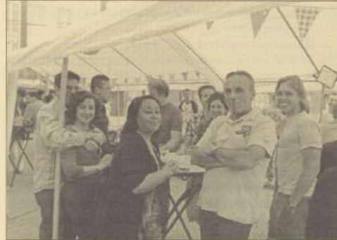
Enkele bewoners van de Marconistraat met elkaar in dialoog.

Op zaterdag 24 september werd er, tijdens de Nationale Burendag 2011, een straatfeest georganiseerd door en voor de 'nieuwe' bewoners van de Marconistraat. Enkele bewoners hebben zich samen gepakt om een leuke dag te organiseren voor de straat. Hoofddoel van het straatfeest was om de burens nader met elkaar in contact te brengen en de sociale cohesie in de voormalige Electrobuurt te vergroten. Het werd een zeer gezellige avond met BBQ, drankjes, muziek en een programma voor de kinderen. Kortom, voor herhaling vatbaar!