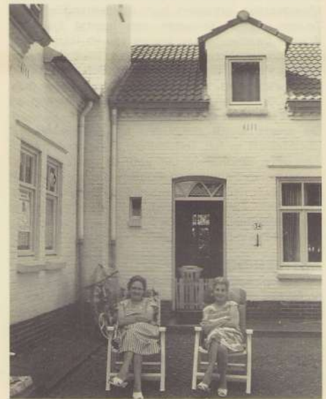
De foto's boven en beneden zijn gemaakt in 1989, toen bij het Schepenenplein een unieke kermis werd georganiseerd b.g.v. het gouden jubileum van de kerk