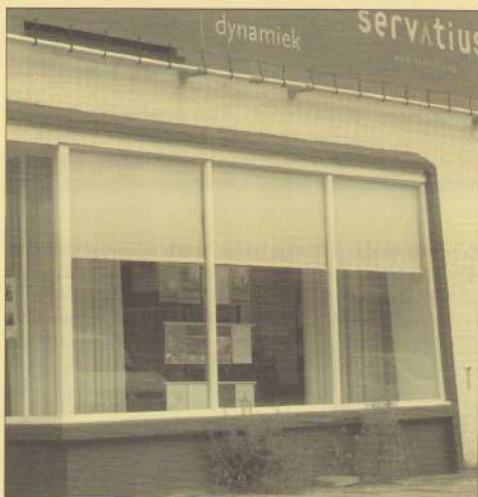
De buurt vergroent! Gelukkig maar, zult u denken. Iedereen is het er toch langzamerhand over eens dat we te weinig groen hebben. Nu tiert het onkruid welig, dat helpt... Daarbij nog een bloembak en een bankje voor de wachtenden!