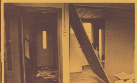
Doorzicht op keuken en hal