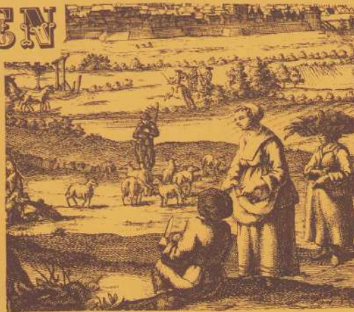
VREDE OP AARDE ZONG IN DE KERSTNACHT HET ENGELENKOOR. EEN KRIBBE IN DE ST. PIETERSBERG, HERDERS IN HET WITTE VROUWENVELD OP EEN PRENT VAN MAASTRICHT UIT 1715 EN EEN FOTO VAN ONS MAAGDENKOOR ROND 1930 BRENGEN HET OUDE VERHAAL IN BEELD. HET MAAGDENKOOR WERD OPGERICHT IN '27 ENGING EIND 60er JAREN OP IN HET KERKKOOR.