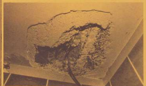
Gaten in plafond