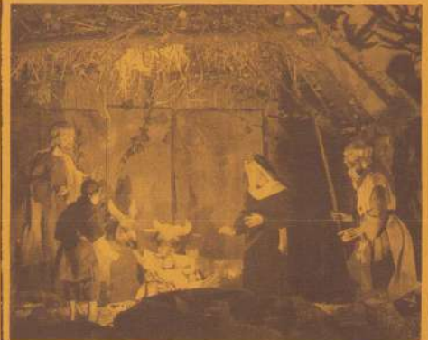
kerstgroep O.L.V.v. Lourdeskerk

Voor het eerst valt in onze buurt een levende kerststal te bewonderen, uitgevoerd door kinderen van de St. Theresiaschool. Er zijn zelfs een echte ezel en schapen aanwezig. Ook een aantal ouders verlenen hieraan hun medewerking. Een en ander wordt muzikaal opgeluisterd door leerlingen van de Gele Ridders. Dit alles vindt plaats op zondag 22 dec. van 14.00 - 16.00 op Us Weijke (achter het Trefcentrum).