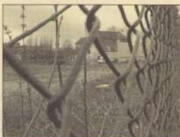
Sanering Essentterrein nog onzeker

Ooit hebben we als Buurtplatform een flat van het geplande buurtpark weten weg te praten. Ons argument toen: er is al zo weinig groen in