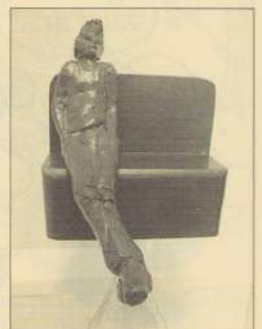
De nieuwe Manus is klaar en zoekt nu een plekje in de buurt!