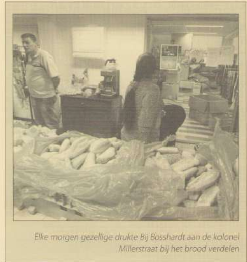
Elke morgen gezellige drukte Bij Bosshardt aan de kolonel Millerstraat bij het brood verdelen

Carnavalsvereniging De Drommedarisse haalt in het vervolg het oud papier op de eerste zaterdag van de maand op. In het verleden was dit de derde zaterdag.