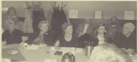
begin november kwamen vertegenwoordigers van onze buurtverenigingen bij elkaar om een handtekeningenactie voor te bereiden

In onze wijk woont sinds ruim drie jaar een Iraakse familie. De vader is in 1997 voor het schrikbewind van Saddam Hoessein gevlucht naar Nederland. Toen lukte het hem vrij te komen uit de gevangenis van Bagdad, dank zij hulp (omkoping) door familieleden. Hij zat daar vanaf 1993, beschuldigd van politieke activiteiten tegen het bewind van de regering. In de gevangenis is hij tijdens ondervragingen zwaar mishandeld. Zijn vrouw en hun vier kinderen waren ondertussen ook gevlucht uit Irak, zaten illegaal in Syrië. In Nederland deed de vader voor hem en zijn gezin een asielaanvraag. Op 16 november 2000 lukte dat, hij kreeg de hoogste vluchtelingenstatus (A-status) en daarmee ook toestemming zijn vrouw en kinderen definitief uit Syrië over te laten komen. Na een heel moeilijke tijd konden ze eindelijk een veilig en nieuw leven beginnen! In mei 2002 betrokken ze een woning in onze wijk, de kinderen wendden snel, kregen hier vriendjes, volgden onderwijs. Het nieuwe bestaan kreeg vorm en hoop.