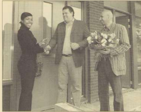
De dochter van mevrouw St. Jacoba ontvangt als eerste de sleutels van het nieuwbouwappartement aan de Edisonstraat.

De oplevering van de eerste appartementen was in eerste instantie in april gepland, maar dit werd door