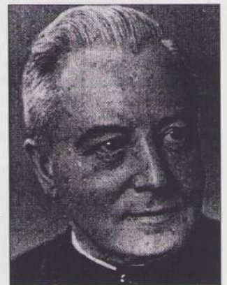
Een zaligverklaring van " 't sjoenste verken van de (Re-mundsje) verkenmerret" zit er niet (meer) in.

* Janssen was zelfs een soort "diskjockey" toen nog niemand van dat woord gehoord had. In de 50'er jaren werden vanuit de kerktoren de "nieuwste" 78-toeren grammofoonplaten van o.a. Jo Erens op luide wijze grijsgedraaid.