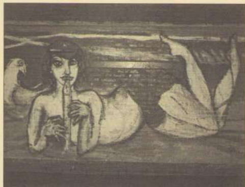
Wie schilderde dit?