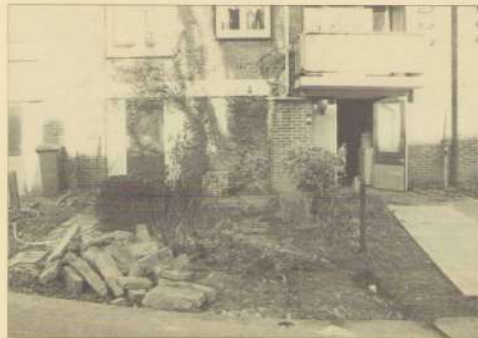
Daar gaat je pracht-tuin.

zelf ook vond. Mevrouw heeft in haar portiek nog eens met haar burens gesproken, die gekozen hadden voor een gezamenlijke tuin. De uitslag daarvan is dat in hun tuin de situatie blijft zoals ze is: elke woning houdt gewoon zijn stukje tuin. Op papier staat de afspraak die ze met haar burens gemaakt heeft: zij zal voor hen de tuinen onderhouden. Iedereen blij: de vijf andere bewoners van het portiek hadden geen zin om de tuin nog te doen, en mevrouw heeft nu een grote tuin die ze zelf kan aanleggen en onderhouden! Wat de populier betreft: Woonpunt zei haar dat we niet verantwoordelijk kunnen en willen zijn voor de holle boom. Bij een harde storm is er nl. het risico dat de boom op het dak van de Nierstraszstraat valt. Uiteindelijk kan mevrouw er nu mee leven dat er een nieuwe boom geplant wordt in haar tuin, een die niet zo hoog wordt als deze. De voortuintjes konden in dit tuinenproject niet worden aangepakt, daar was geen geld meer voor. Maar wie weet raken de bewoners wel weer enthousiast en maken ze er zelf weer wat moois van.