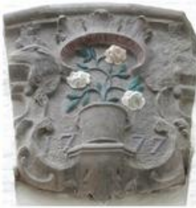
Uit het depot en herplaatst Bouillonstr. 14