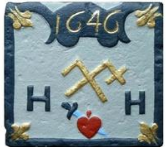
Uit het depot gehaald en opgeknapt; klaar voor herplaatsing