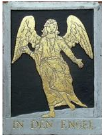
Opgeknapt met bladgoud