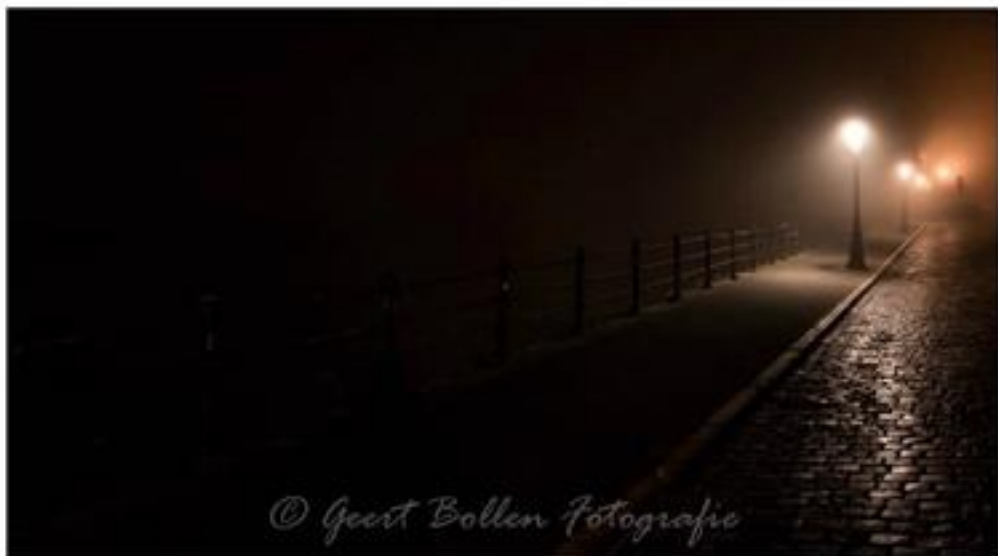
© Geert Bollen Fotografie Foto van de maand redactie keuze : Geert Bollen