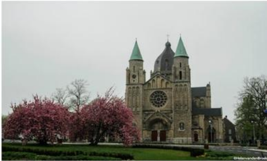
Foto van de maand februari 2017 meeste likes: Helen van den Broek - Nobelen