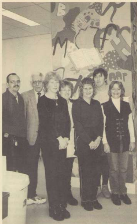
Enkele vrijwillig(st)ers in de ruimte van Steunpunt Bieb op de bovenverdieping van de Theresiaschool. Deze ruimte kreeg tegelijk met het hele schoolgebouw afgelopen jaar een fraaie opknabbeurt.

REDAKTIEADRES: AARTSHERTOGENPLEIN 24 6226 XZ - MAASTRICHT TEL.: 3620066 FAX.: 3621263 BANKREK. NR. S.N.S. 862605253 OPLAGE: 2850 VOLGENDE BUURTKRANT VERSCHIJNT 4 DECEMBER KOPIJ INLEVEREN VOOR 20 NOVEMBER