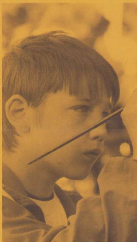
Foto: Patrick werkt zeer geconcentreerd aan een werkstuk.

Deze boodschappen werden tijdens de week in een speciaal hiervoor gekomen bus met mensen van de Internationale Vierde Wereld Beweging opgesteld. Overal in Europa worden deze WEKEN VAN GEDEELDE TOEKOMST georganiseerd. En via de computer, een modem, een telefoonlijn en internet, stonden al deze WEKEN met elkaar in verbinding. Zo konden de kinderen ook over de grenzen van ons pleintje en onze wijk heen, bouwen aan een vriendschapsketen met iedereen.