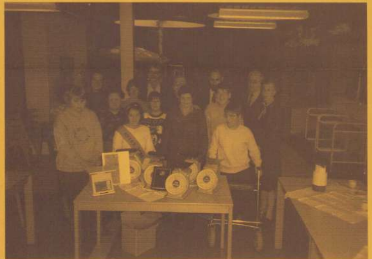
Medewerkers en bewoners van Maasveld en de aanwezigen met hun nieuwe "Weegsjoolen".