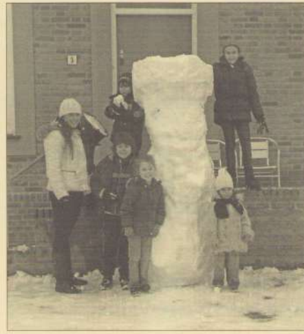
Winterpret in de Pijlstraat